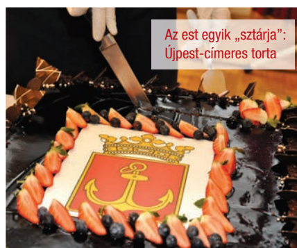
Az est egyik „sztárja”: Újpest-címeres torta