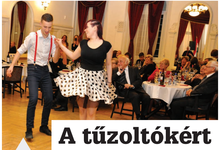
Tánc nélkül nincs bál