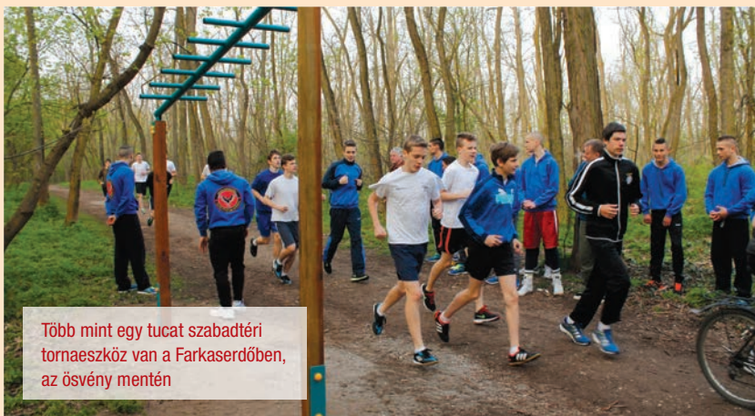
Több mint egy tucat szabadtéri tornaeszköz van a Farkaserdőben, az ösvény mentén

Ami mondjuk 20 évvel ezelőtt természetes volt, azt ma már szinte csak előre kidolgozott tervek, praktikumok, jól felépített, fegyelmezett életvezetés mellett lehet elérni. Friss levegő, elegendő mozgás, megfelelő táplálkozás, aktív közösség élet, sok természet, minél kevesebb szobában gubbasztás.