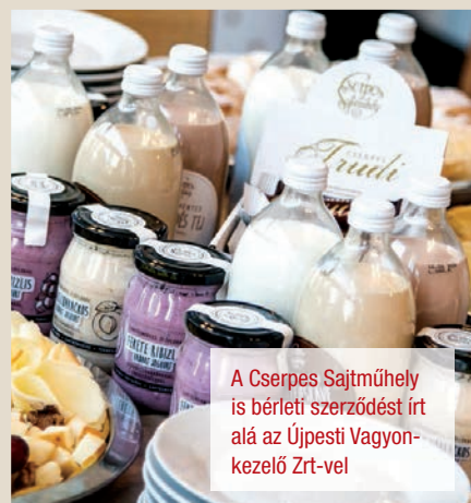
A Cserpes Sajtműhely is bérleti szerződést írt alá az Újpesti Vagyonkezelő Zrt-vel