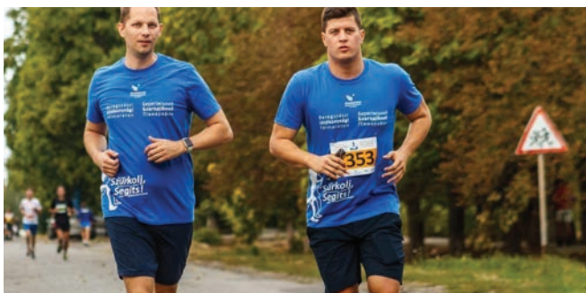
Az oldalt összeállította: GERGELY GÁBOR

– Másfelől ez annak is köszönhető, hogy tisztában vagyok azzal, milyen a határon túli, közte a kárpátaljai magyarság helyzete – mondta az olimpiai bajnok. – Hangsúlyozta, jelenlétével szeretné felhívni a figyelmet a határon túli magyarság és az anyaország közötti kapcsolattartás fontosságára, és arra szeretne biztatni mindenkit, aki teheti, támogassa a rászorulókat Kárpátalján a 1335-ös adományvonal tárcsázásával; hívásonként 250 forint adományozható a kárpátaljai segélyprogram támogatására. A befolyt összeget rászoruló családok, hátrányos helyzetű gyermekek képzésének támogatására, egyedülálló idős emberek téli tüzelővel történő ellátására fordítják.