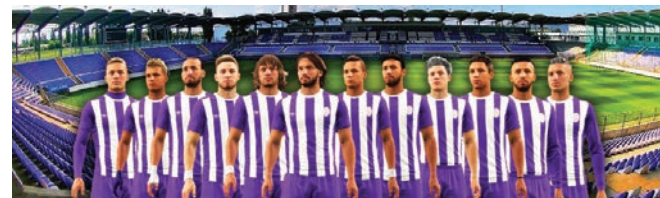
Magyar Kupa R32 UTE e-Sport - FC Rivincita 1:0 Gólszerző: Valent1n94

A találkozó harmadik percében Hideghetes szép kiugratása után Valent1n94 gólrá váltotta a ziccert (1-0). A gyorsan szerzett vezető találat megnyugtatta a csapatot, végig irányították a mérkőzést. Szép számmal akadtak még lehetőségek az előny növelésére, azonban hol a kapufa, hol az ellenfél kapusa hátrított. Szerencsére az egygólos előny kitarított a találkozó végéig. Örömmel, hogy egy küzdelmes meccsen, végül is győzelemmel mutatkoztak be a legfiatalabb újpesti szakosztály versenyzői a szurkolóknak.