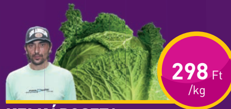
KELKÁPOSZTA Dream Come True Kft.-nél

Az esetleges szerkesztési vagy nyomdai hibáért felelősséget nem vállalunk. A képek csak illusztrációt szolgálnak.