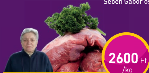
VADDISZNÓ Vadász Kamrájánál