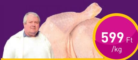
CSIRKECOMB FARRÉSSZEL Duna-Muhari Bt.-nél