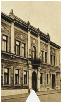
A Munkásotthon épülete 1928-ban

Tudtommal csak Csepelen és Kispesten van vagy volt Munkásotthon az újpestin kívül. Mert ahol munkások voltak, ott lenni kellett munkásotthonnak is! Az épületet sajnos elvitte a lakótelep-építés és az utcát is. Én sajnálom.