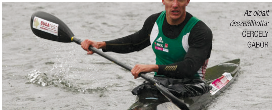
Az oldalt összeállította: GERGELY GÁBOR

– Mindig is szerettem volna a sport közelében maradni – mondta –, ezért is örülök annak, hogy sikerült a diáksportszövetséggel megállapodnunk. Nagy kihívás, de én szeretem a komoly feladatokat. Szerintem nincs is hasznosabb, mint a fiatalság nevelése, hiszen belőlük fog állni a jövő a későbbiekben.