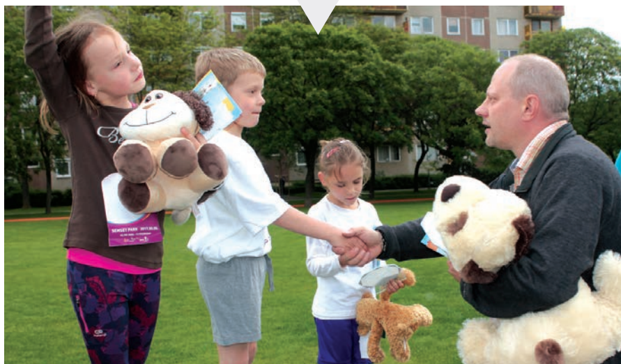
Az óriástársast is mindenki imádtta