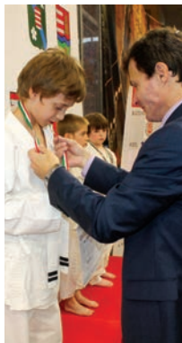
Az oldalt összeállította: GERGELY GÁBOR