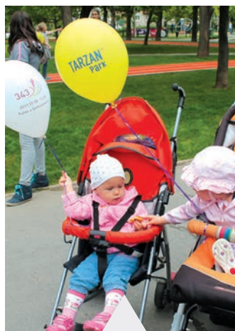
Voltak, akik csereüzlet reményében érkeztek