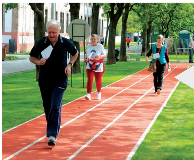
Szórakozás az egész családnak

Május 5-én hivatalosan is átadták a teljesen megújult Semsey parkot. Újpest Önkormányzata egész délután sportfesztivállal várta az érdeklődőket.