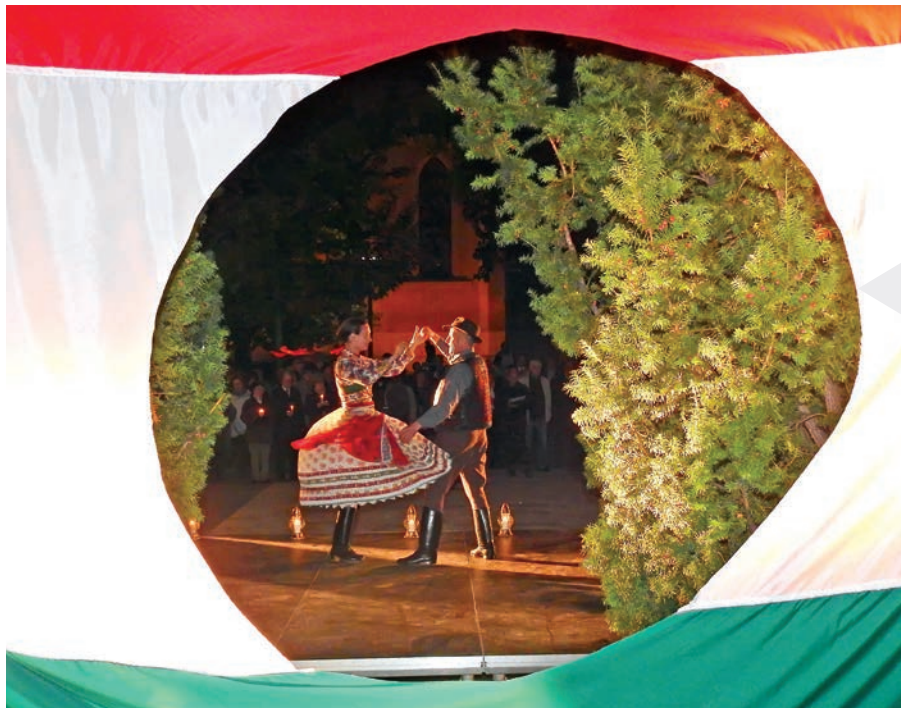
A Bem Néptáncgyűttes kalotaszegi tánca a Szent István téren