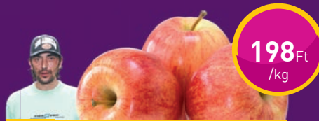
ALMÁK Dream Come True Kft.-nél