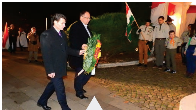
Koszorúzással egybekötött megemlékezés az 1956-os forradalom és szabadságharc hősei emlékére

gyűjtották be mindenütt a forradalom lángját. Másnapra fellelkesült sokaság lepte el itt, ezeket az utcákat, tereket is. A tüntető újpestiek 24-én ledöntötték a szovjet emlékművet, a zsarnokság jelképét. Az Egyesült Izzóban megalakult az országban az első munkástanács, a Tanácsházán pedig az Újpesti Forradalmi Bizottság. 1956 volt az első, félreérthetetlen jelzés a világ számára. Lerántotta a leplet a kommunista rendszer igazi természetéről. Többé senki sem lehetett jó szándékkal, tiszta szívvel a kommunizmus híve. A magyar forradalom egyúttal megjövendőlte azt is, hogy az embertelen rendszer előbb vagy utóbb össze fog omlani. Ez a forradalom volt az első nagy repedés a kommunizmus talapzatában. (...) 1956 tragikus dicsősége megváltoztatott minket, és a történelem regényét is átírta. De ez a regény nem ér véget, és most éppen mi írjuk. Mindannyian, akik most itt vagyunk, mindannyian, akik ebben az országban és a Kárpát-medencében élünk. Írjuk úgy, ahogy ők írták 56-ban. Bátran és igazan! Dicsőség 1956 hőseinek!”