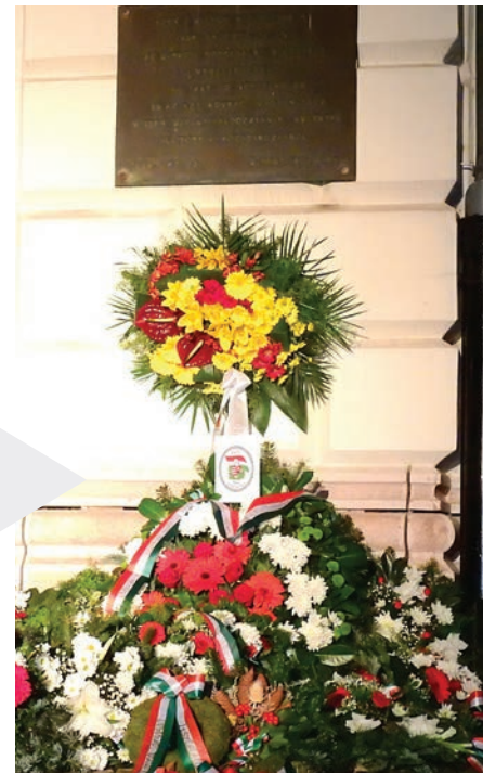
Dicsőség a hősöknek!