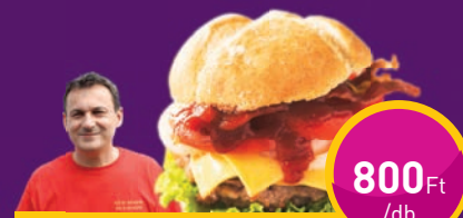
ÓRIÁS BURGER Grill Gérosnál