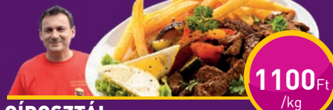
GIROSZTÁL Grill Gírosnál