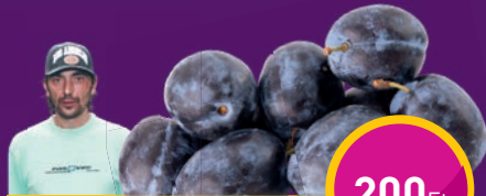
BESZTERCEI SZILVA Dream Come True Kft.