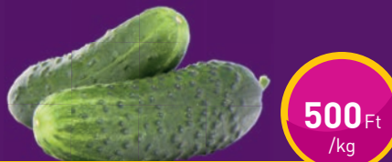
SZAFITOS KOVÁSZOS UBORKA Sauer Bt.-nél