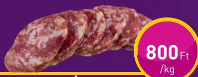
KAKASKOLBÁSZ Báncs Ferencnél