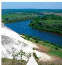
A legnagyobb harcok helyszíneinek egyike a Don mentén