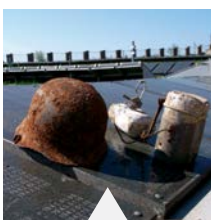
Táblákon a magyar hősök nevei a rudkinói központi magyar katonai temetőben, köztük az újpesti orvosé