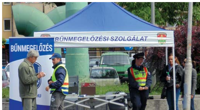
Ismét forgalmas helyszín és teljes körű tájékoztatás

A másik módszer unokázás néven vált ismertté, lapunkban és az ujpest.hu -n is sokszor felhívtuk rá a figyelmet, aminek köszönhetően könnyebben ismerik fel a csalásformát az idősek. Továbbra sem szabad bedőlniük olyanoknak, akik az éjszakai órákban unokaként bemutatkozva telefonálnak azzal, hogy balesetet szenvedtek/okoztak, bajba jutottak és pénzre van szükségük. Azt sem szabad elhinni, hogy a hozzátartozó okozott balesetet, minden esetben olyan adatokat kell kérdezni a telefonálótól, amit csak a valódi rokon tudhat. A pénz útgyzintén nem szabad ismeretlenek átadni.