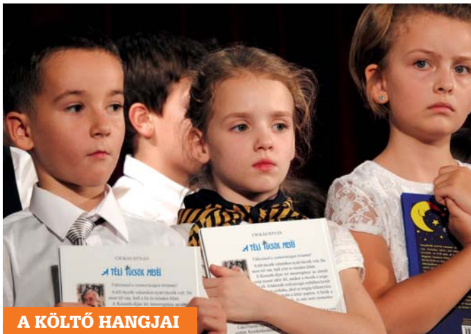
A KÖLTŐ HANGJAI