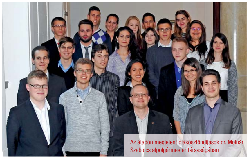
Az átadón megjelent diákösztöndíjasok dr. Molnár Szabolcs alpolgármester társaságában