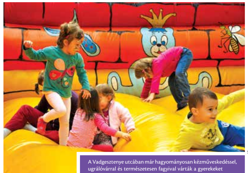
A Vadgesztenye utcában már hagyományosan kézműveskedéssel, ugrálóvárrel és természetesen fagyival várták a gyerekeket