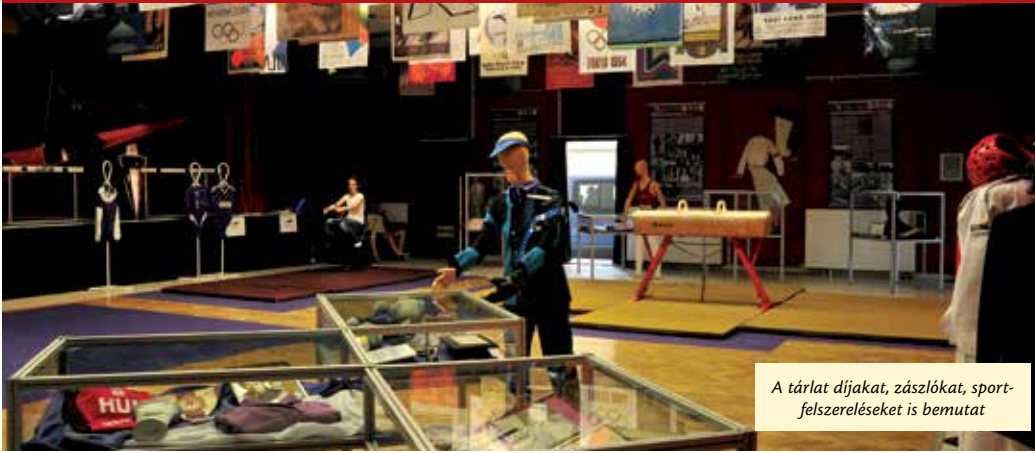
A tárlat díjakat, zászlókat, sportfelszereléseket is bemutat