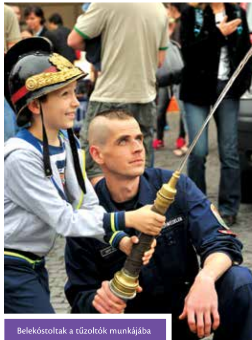
Belekóstoltak a tűzoltók munkájába