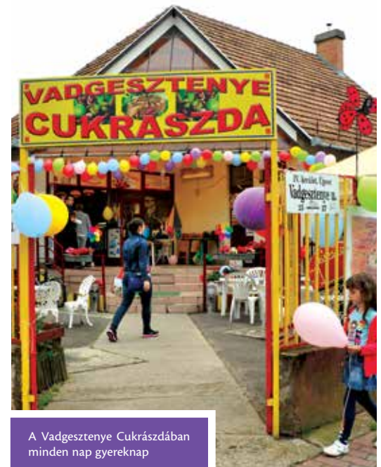
A Vadgesztenye Cukrászdában minden nap gyermeknap