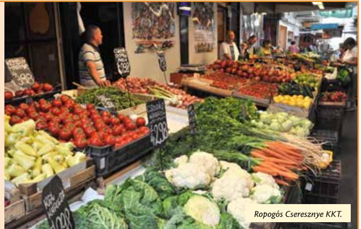
Ropogós Cseresznye KKT.

Köszörüs a Virágcsarnok bejáratánál szerdán és csütörtökön 8-tól 13.30-ig, pénteken 8-tól 14.30-ig, szombaton 8-tól 12.30-ig, vasárnap változó nyitva tartással.