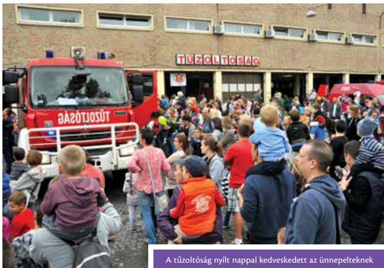
A tűzoltóság nyílt nappal kedveskedett az ünnepelteknek