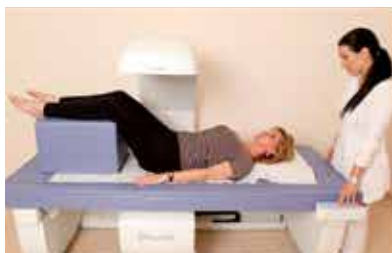
Teljes test csontsűrűségmérés