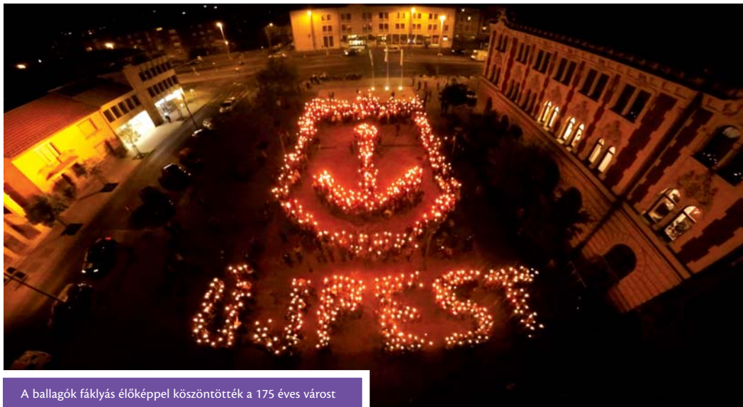
A ballagók fáklyás élőképpel köszöntötték a 175 éves várost

A már hagyománnyá vált fáklyás ballagással búcsúztak a középiskolások újpesti diákéveiktől. Az utolsó tanítási napot megelőző ünnepséget minden évben más középiskola szervezi, idén a 110 esztendőes Könyves Kálmán Gimnázium tanulóié volt a megtisztelő feladat.