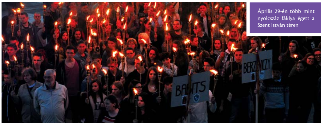
Április 29-én több mint nyolcszáz fáklya égett a Szent István téren