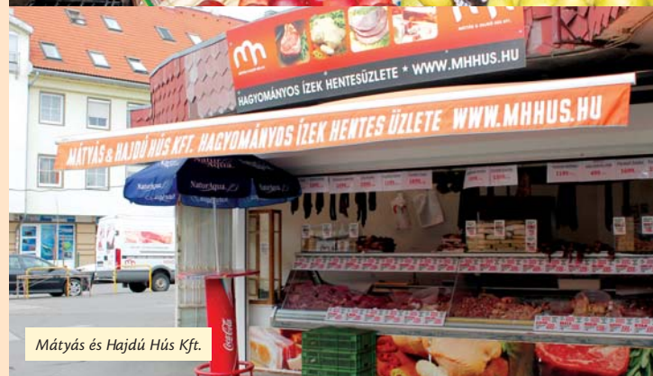
Mátyás és Hajdú Hús Kft.