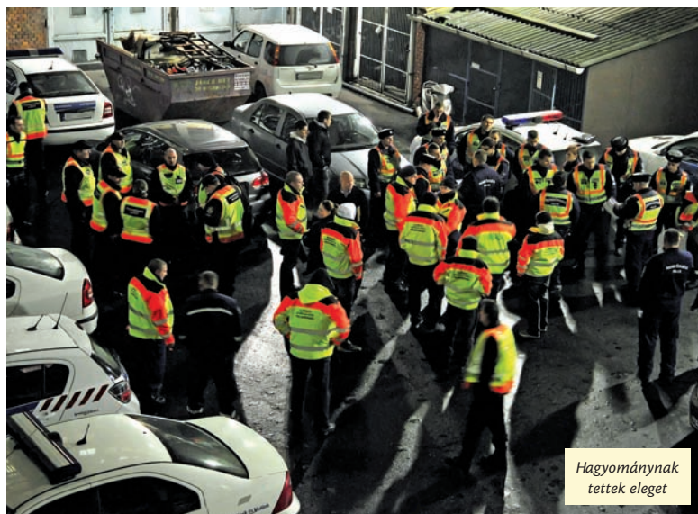
Hagyománynak tettek eleget

Noha a fokozott ellenőrzés tényét a BRFK bejelentette, és a belvárosban is zajlott egy hasonló akció, az eredmények most is önmagukért beszélnek.