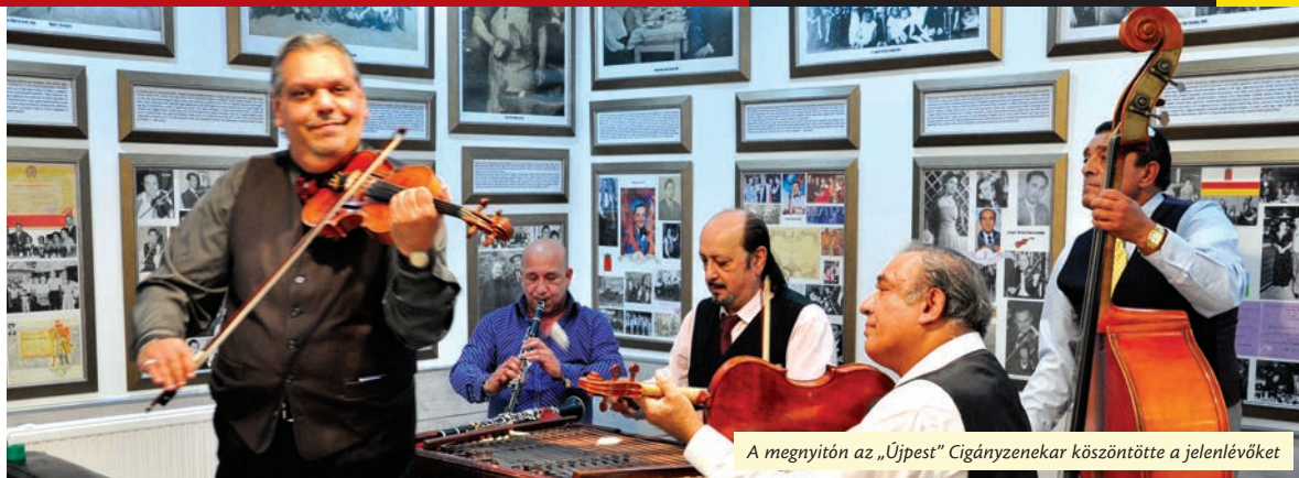
A megnyitón az „Újpest” Cigányzenekar köszöntötte a jelenlévőket

A Tél utcában átadták az Újpesti Roma Nemzetiségi Önkormányzat felújított és funkcióiban kibővített, a tanodának is otthont adó épületét. Ugyanitt megnyílt az Újpesti Cigány Helytörténeti Gyűjtemény.