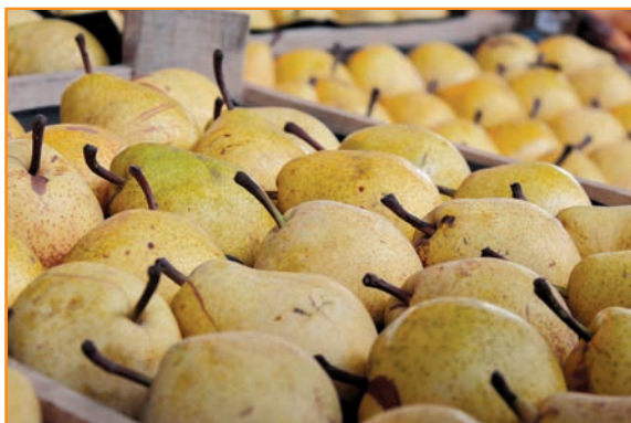
Akcións ajánlatok október 16–22. között!