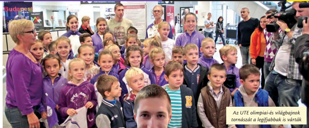
Az UTE olimpiai-és világbajnok tornaszát a legifjabbak is várták