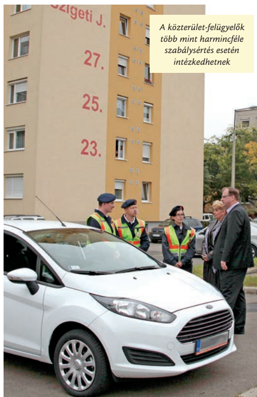
A közterület-felügyelő több mint harmincféle szabálysértés esetén intézkedhetnek

Kiemelte, feladataik közé tartozik többek között a rendezvények biztosítása, a közterületek rendjének védelme, a hulladékot illegálisan kihelyezők tettenérése,