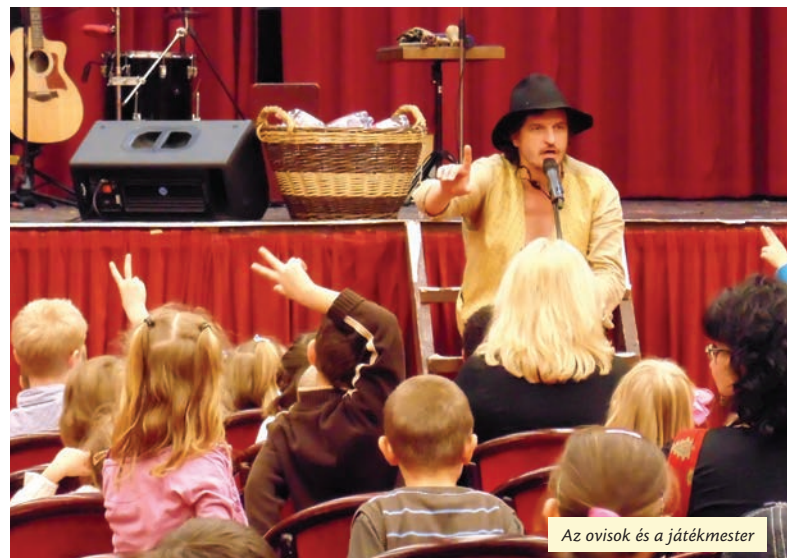
Az ovisok és a játékmester