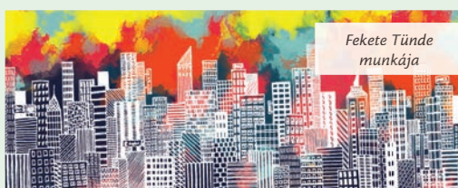
Fekete Tünde munkája