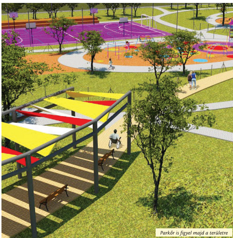
Parkör is figyel majd a területre