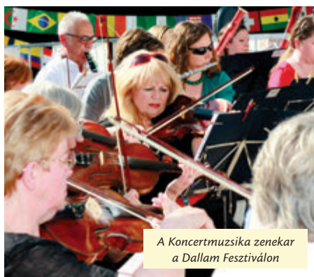
A Koncertmuzsika zenekar a Dallam Fesztiválon

Az október 25-i premieren minden adott a sikerhez: kellő vitamennyiséggel kidolgozott, izgalmas történet ismert színészek előadásában, a pislákoló gázláng halvány fényében. J. M.