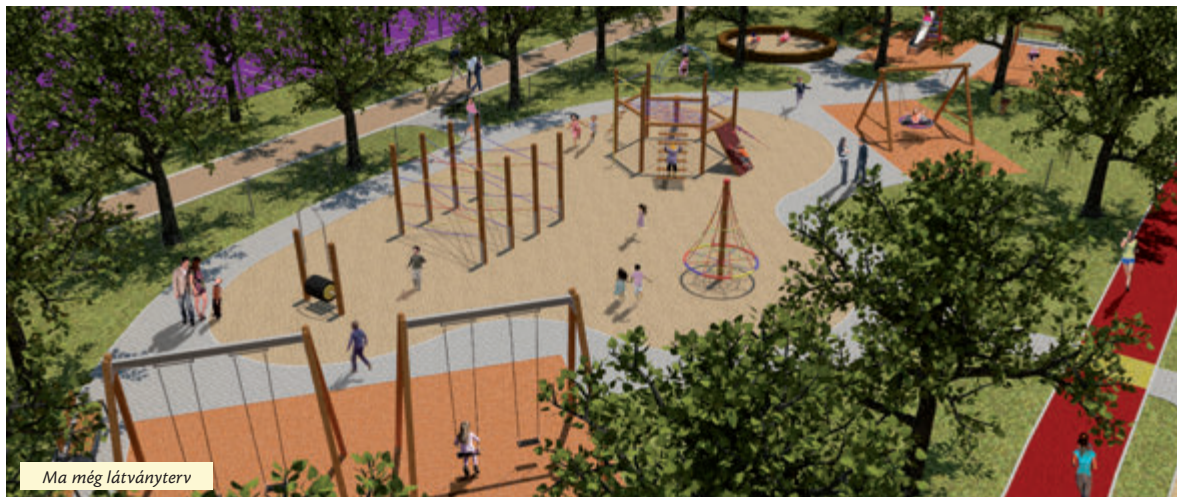
Ma még látványterv

Az Újpest egykori polgármesteréről elnevezett Semsey Aladár park városunk egyik legnagyobb lakótelepi parkja, amely az elmúlt évtizedek során sokat veszített korábbi fényéből. Hamarosan azonban szinte minden részlete megújul. A környéken élők már észrevehették, hogy a munkálatok a sportpálya építésével el is kezdődtek.