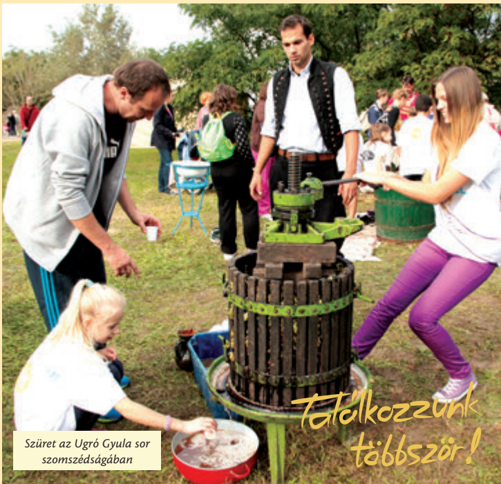
Szüret az Ugró Gyula sor szomszédságában