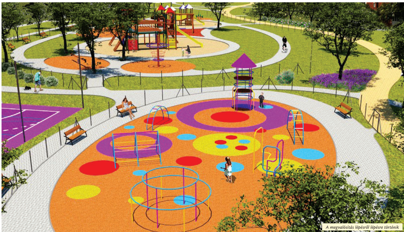
A megvalósítás lépésről lépésre történik