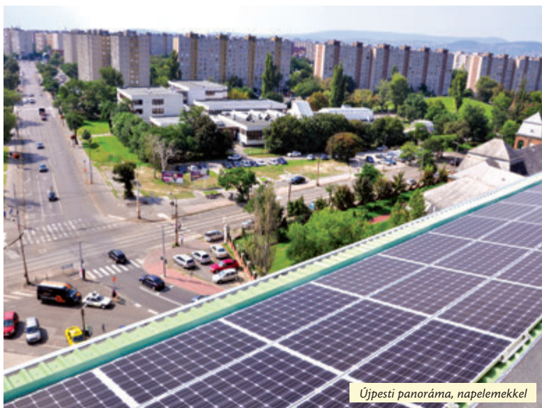
Újpesti panoráma, napelemekkel

Ebben az évben is számos fejlesztés történt az újpesti iskolákban. A kerékpáros közlekedést támogatandó biciklitámaszok épültek az óvodákhoz, iskolákhoz, több intézmény homlokzata megújult, másokban nyílászárókat cseréltek és szeptembertől mindenhol felújított ebédlőben étkezhetnek a gyermekek.