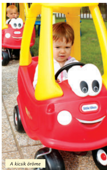
A kicsik öröme