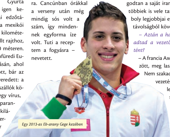
Egy 2013-as Eb-arany Gege kezében

– Általában két kiló simán lemegek, de például Mexikóban több mint három kilót vesztettem a súlyomból, igaz, ott nagyon meleg volt a tenger, harmincfokos. Ráadásul ilyenkor egy darabig még enni sem tud az ember, teljesen összehúzódik a gyomra. Cancúnban órákkal a verseny után még mindig sós volt a szám, így mindennek egyforma íze volt. Tuti a receptem a fogyásra – nevetett.