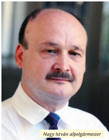
Nagy István alpolgármester

Számos támogatóval és közreműködő partnerrel, gazdag kínálattal várja az újpestieket szeptember 29-én a Káposztásmegyeri Egészség- és Sportnap. Az 9 órakor kezdődő egészségnapal párhuzamosan, pár méternyi távolságban zajlik az Újpesti Futó- és Kerékpáros Fesztivál.