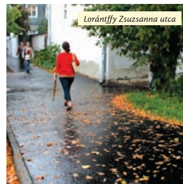
Lorántffy Zsuzsanna utca