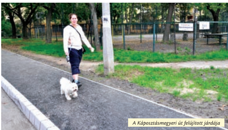
A Káposztásmegyeri út felújított járdája

Nem ez volt az egyetlen felújítás a közelmúltban a 7. számú választókerületben. Nemrég készült el a Káposztásmegyeri út járda felújítása a Fóti út és Bródy Imre utca közötti szakaszon.