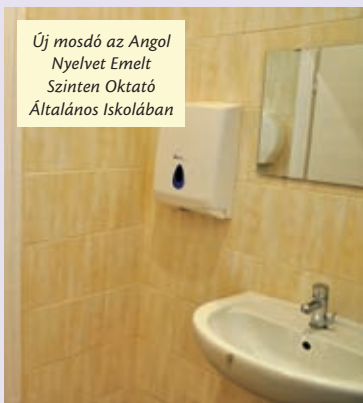
Új mosdó az Angol Nyelvet Emelt Szinten Oktató Általános Iskolában