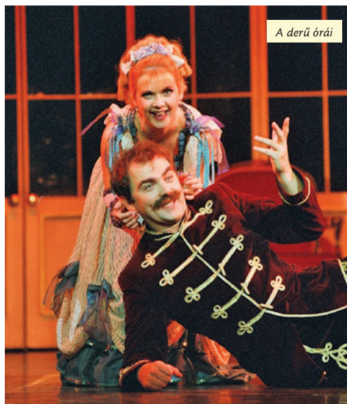
A derű órái

Az önkormányzat a ma is nagy sikerrel játszott Kálmán Imre-operett, a Marica grófnő megtekintését ajánlja szeptember 14-én, vasárnap 15 órai kezdettel a Jéggpalotában. A Turay Ida Színház a vendégjátékra parádés szereposztással érkezik: