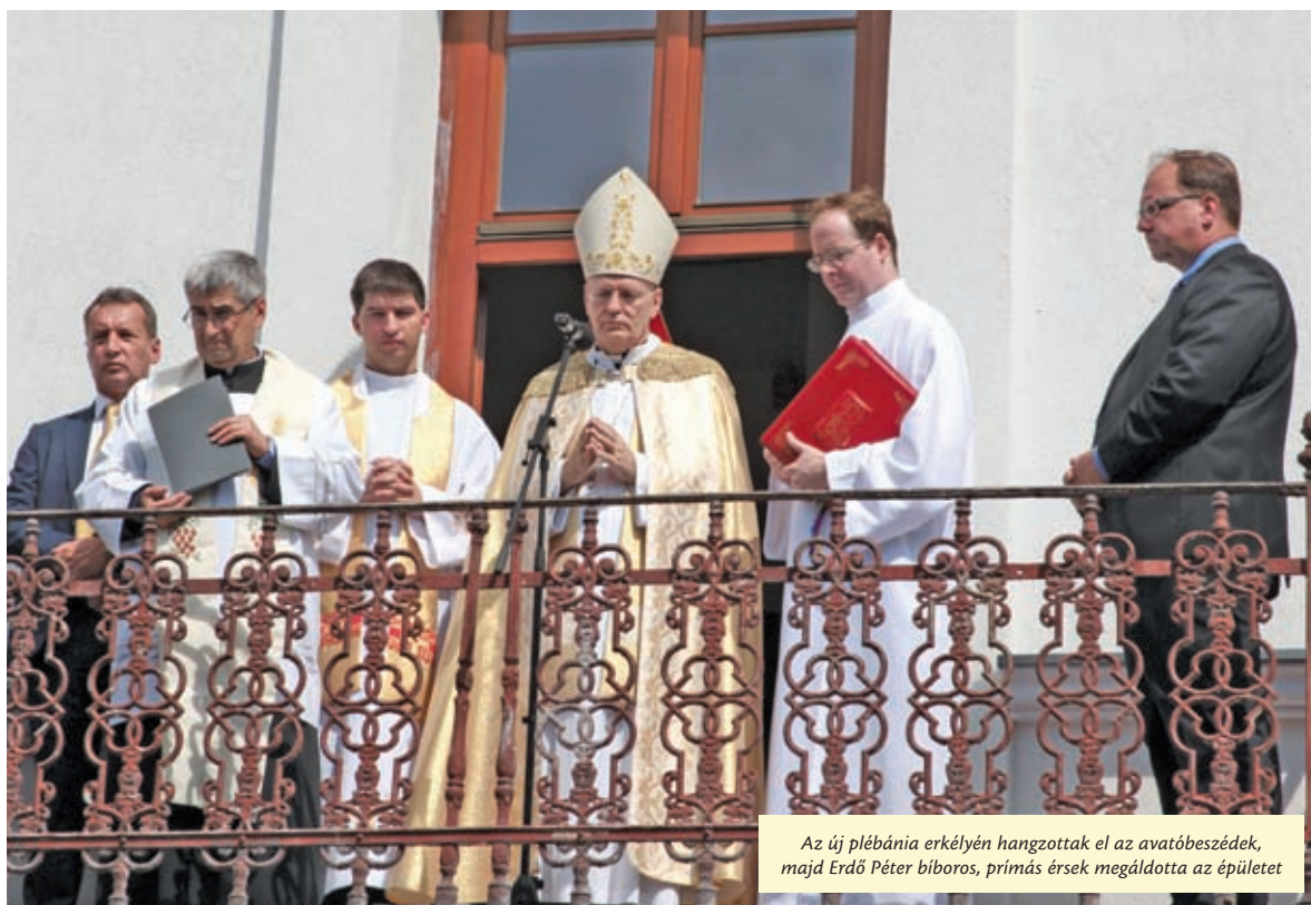
Az új plébánia erkélyén hangzottak el az avatóbeszédék, majd Erdő Péter bíboros, prímás érsek megáldotta az épületet

Augusztus 24-én, vasárnap délelőtt tíz órától ünnepi szentmisét celebrált