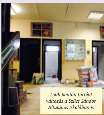
Több ponton történt változás a Szűcs Sándor Általános Iskolában is