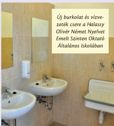
Új burkolat és vízvezeték csere a Halassy Olivér Német Nyelvet Emelt Szinten Oktató Általános Iskolában