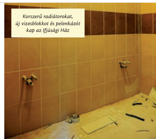
Korszerű radiátorokat, új vizesblokkot és pelenkázót kap az Ifjúsági Ház

gessé vált a megújulás. Télen, amikor a szabadtéri rendezvények szünetelnek, színház- és kiállítóterme megannyi élménnyel vár mindenkit, a rengeteg gyermekprogram pedig remek kikapcsolódás a szórakozni vágyó aprónépnek. Mivel a babaszínház látogatóiként vagy nagyobb testvérek „kísérőjeként” a programokra érkező látogatók között a legminibb korosztály is képviselteti magát, a kiala-