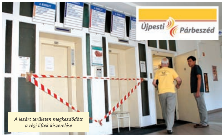
A lezárt területen megkezdődött a régi liftek kiszerelése