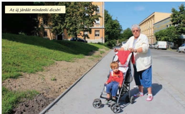
Az új járdát mindenki dicséri

– A hónapokkal ezelőtt elkezdett felújításokat az újpestiek kérése alapján végeztük el. Eddig közel 20 utcában történt kisebb-nagyobb burkolatcseré és az ütemtervünk szerint a munkának még messze nincs vége.