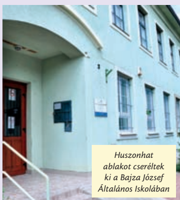
Huszonhat ablakot cseréltek ki a Bajza József Általános Iskolában