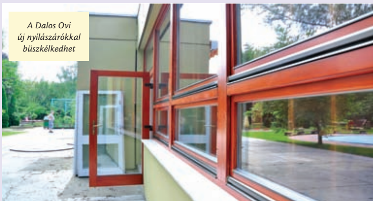
A Dalos Ovi új nyílászárókkal büszkélkedhet