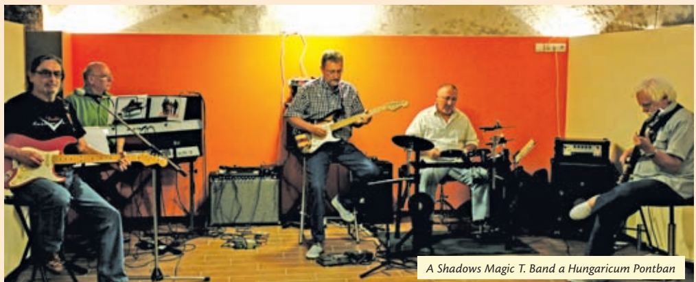
A Shadows Magic T. Band a Hungaricum Pontban

Jó hír a beatrajongóknak: folytatódik a nagy sikerű koncertsorozat, amelynek során a Shadows Magic T. Band tagjai a hatvanas évek muzsikáját hozzák el minden hónap utolsó szombatján Újpestre. Legközelebb július 28-án este hét órakor csapnak a húrok közé, és idézik meg a legendás The Shadows együttest a Szent István téren, a Városháza oldalában lévő Hungaricum Pontban.