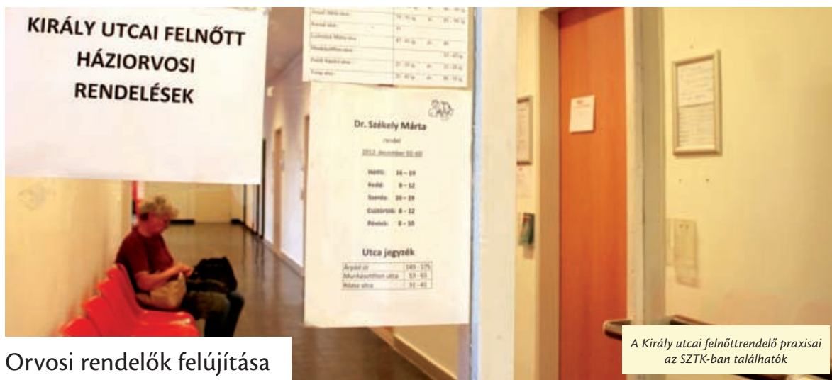
Orvosi rendelők felújítása

– Ezzel a lépéssel az önkormányzat elősegíti és biztosítja, hogy a gyerekek a törvényben előírt koruktól óvodába járhassanak, a bővítés pedig ahhoz is hozzájárul, hogy akár másik körzetből is érkezhessenek ide gyerekek – teszi hozzá. Az óvoda a jövő héttől ismét megtelik a kicsikkel, az új szárnyat szeptember elejétől vehetik teljesen birtokba. MOA