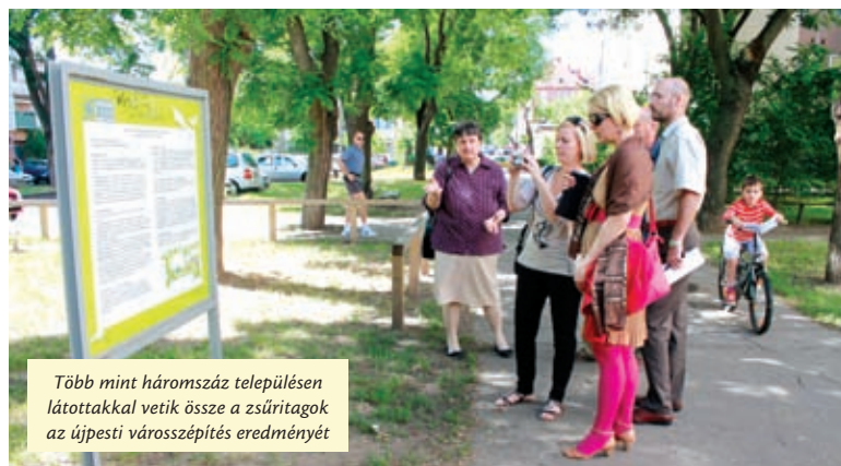
Több mint háromszáz településen látottakkal vetik össze a zsűritagok az újpesti városképzés eredményét