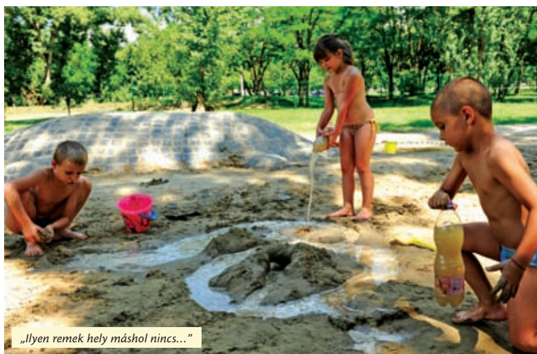
„Ilyen remek hely máshol nincs...”