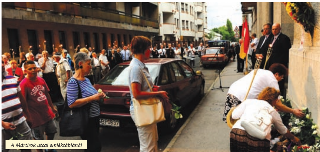
A Mártírok utcai emléktáblánál

Fáklyás meneteléssel, koszorúzással emlékezett Újpest Önkormányzata arra a mintegy tizennyolcezer emberre, akiket hetven évvel ezelőtt napra pontosan július 11-én kezdtek elhurcolni az akkor önálló városból. A Mártírok utcai emléktáblánál Wintermantel Zsolt polgármester, Szerdócz Ervin rabbi és Ilan Mor , Izrael Állam magyarországi nagykövete szólt az emlékezőkhöz.