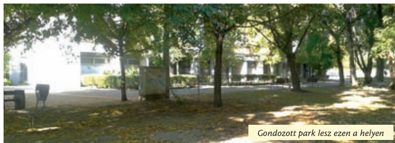
Gondozott park lesz ezen a helyen