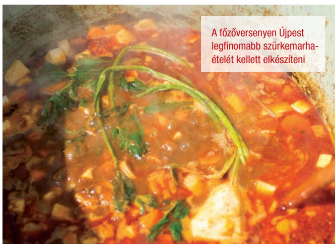
A főzőversenyen Újpest legfinomabb szürkemarha-ételét kellett elkészíteni