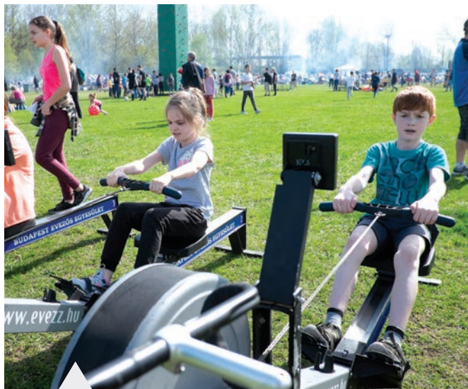
A gyerekeket egész nap sportos pontgyűjtőversennyel várták a szervezők