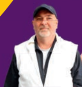
KACSCACOMB Te-So Bt.-nél