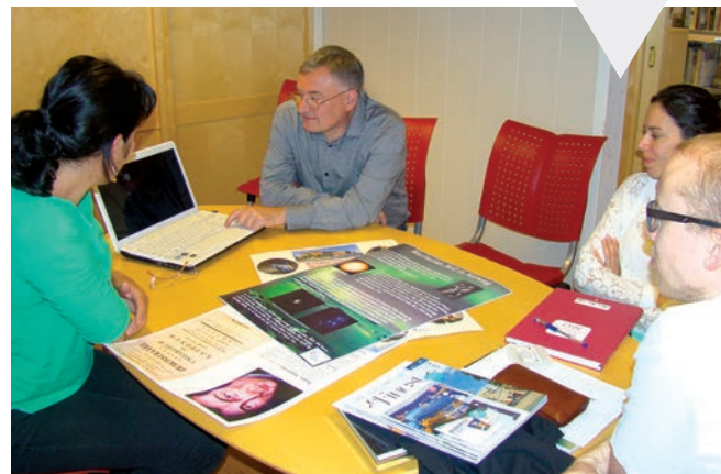
Úrközponti szakmai megbeszélés

Az andenesi Videregående Skole-ban kölcsönösen bemutatott iskoláinkat. Andenesben a 15-16 éves diákoknak lehetőségük van egy