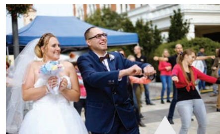
Egy ifjú pár is beszállt a közös táncba