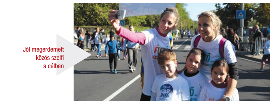
Jól megéredemelt közös szelfi a célban