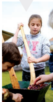
Szőlőpréselésben is kipróbálhatták magukat a fiatalok

Az időjárás sem tudta megzavarni az idei Szüreti Mulatságot. A Bem Néptáncgyűjtés fellépését követően megérkezett az eső, de mire elkezdődtek a délutáni programok, már feloszlottak a felhők, és ismét benépesült a Szent István tér. A nap csúcspontját természetesen a Magashegyi Underground és az Irie Maffia fellépése jelentette.