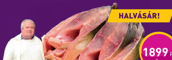
PONTYSZELET Duna-Muhari Bt.-nél