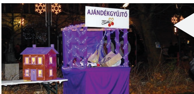
Az Ajándékgyűjtő a templomkertben várja a használt, de jó minőségű játékokat