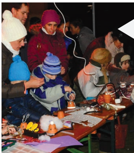
A hideg ellenére is sokan készítettek díszeket, ajándékokat. Aki most lemaradt, ne búsuljon, minden hátralévő hétvégén ismét lesz rá lehetősége