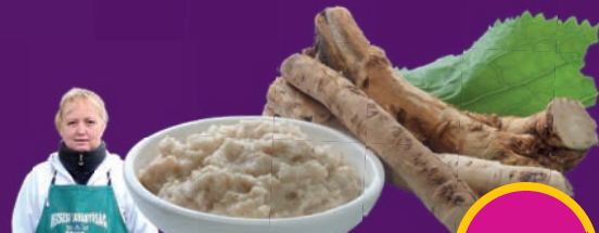
RESZELT ECETES TORMA Sauer Bt.-nél