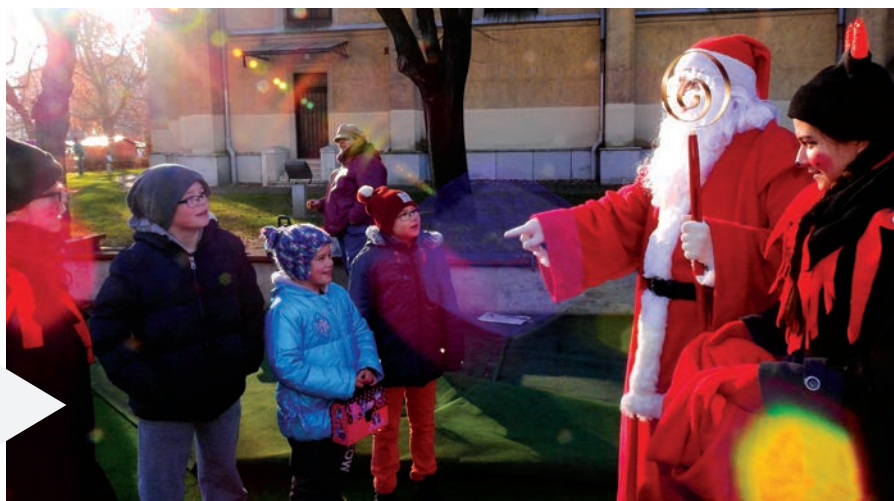
A Mikulás már a délelőtti napsütésben is várta a gyerekeket