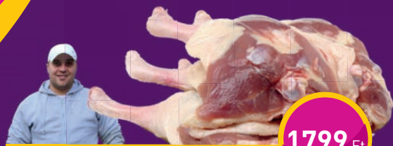
KACSCOMB Mátyás Hús Kft.-nél