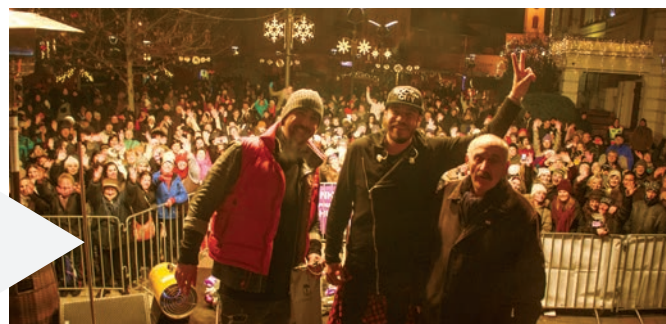
Hatalmas rajongótábor fogadta a TNT-t