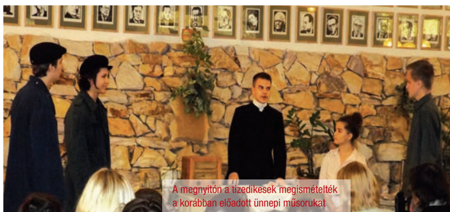
A megnyitón a tizedikesek megismételték a korábban előadott ünnepi műsorukat