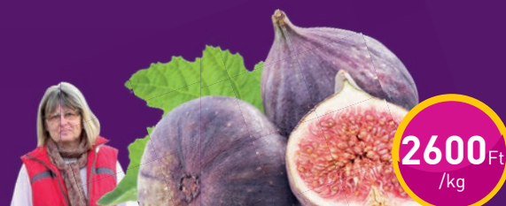
FÜGE Policsány Erikánál