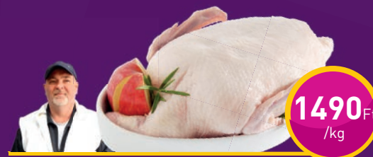
PECSENYELIBA Te-So Bt.-nél