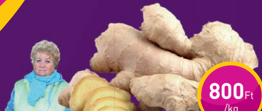
GYÖMBÉR Dream Come True Kft.-nél