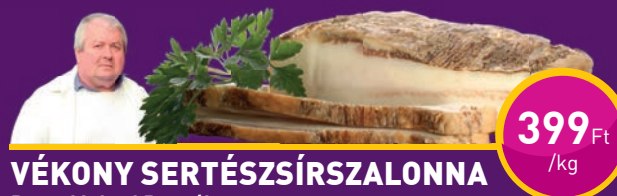
VÉKONY SERTÉSZSÍRSZALONNA Duna-Muhari Bt.-nél