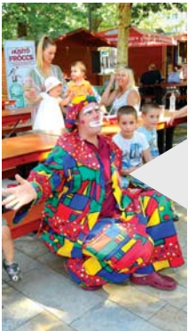
Peppino bohócot most is nagyon imádták a gyerekek