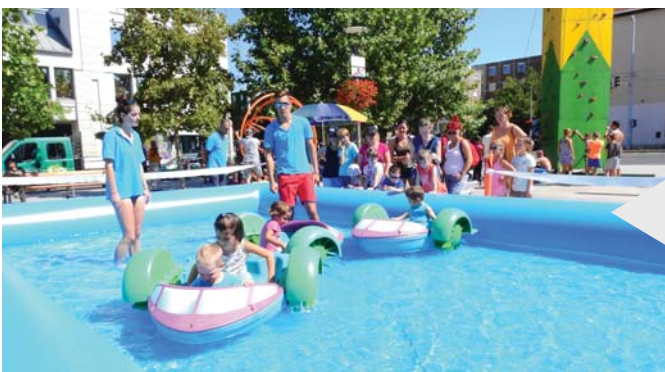
Vizes játék is várta a gyerekeket