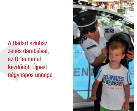
A Hadart színház zenés darabjával, az Orfeummal kezdődött Újpest négynapos ünnepe