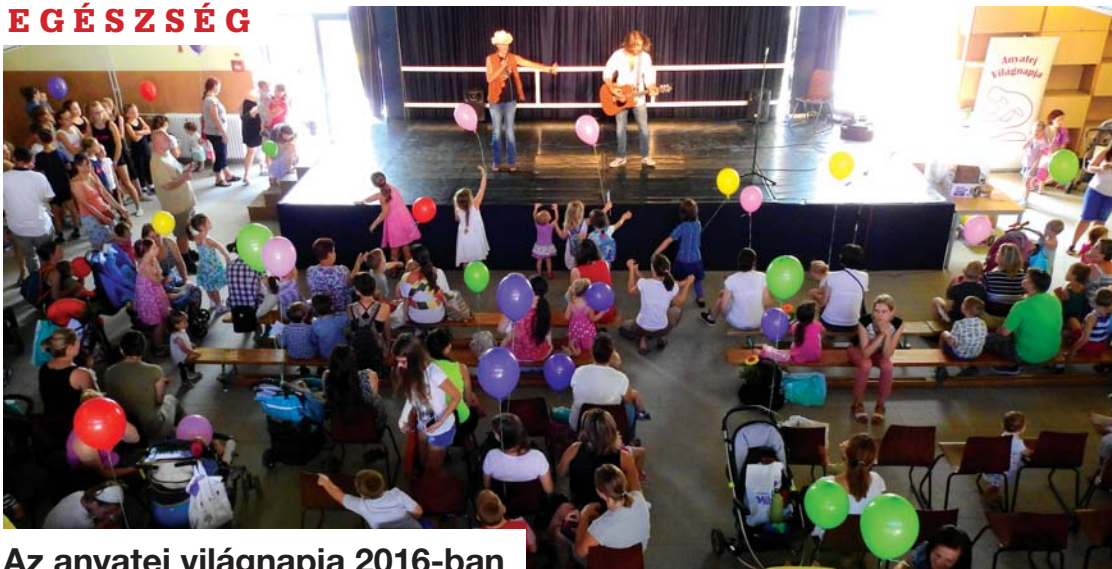
Az anyatej világnapja 2016-ban