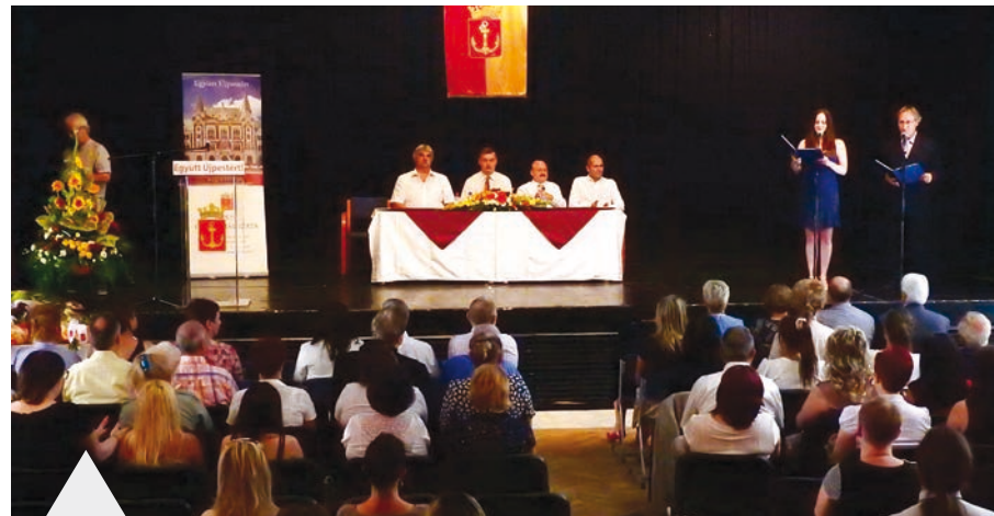
A Semmelweis-nap a magyar egészségügy napja – Újpesten is