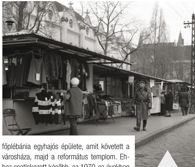
Az Újpesti Piac a 1970-es években

Mert ilyen szempontból talán nem a legszerencsésebb főtér az újpesti, az ország főterei közül. Hogy miként alakult a jelenlegi állapota szerint, azt meghatározta a római katolikus