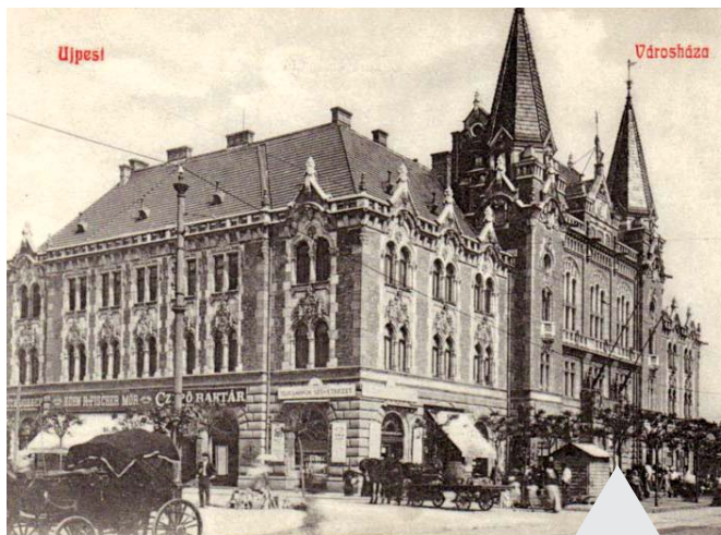
Az Újpesti Városháza az 1920-as években

Időközben, az adminisztráció fejlődésével, mintha kinőtte volna önnön hatáskörét, de attól még egy és oszthatatlan, ha a szemközti épülettel – funkcióit tekintve – oszódott is kicsit, de az maradt, ami volt: a Mi Városházánk! Kissé ódon eleganciájával, nyugodt, kiegyensúlyozott belső tereivel, kellemesen elegáns dísztermével. Úgy, ahogy egy városházához illik. Biztosan