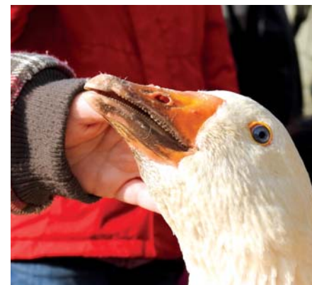
A Márton-napi libaságok előtt és után is nagy volt a nyüzsgés a Piac-Placcon.