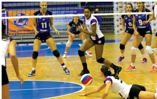
Jászberényi Röplabda Klub – UTE 1:3 (25,-19,-15,-16)

– Már a mérkőzés előtt éreztem, hogy ezt a találkozót nem tudjuk elveszíteni, bár nem felejtettem el, hogy a gödöllői tornán kikaptunk a Berénytől. Az első szettben még túl sok volt a hiba, de amint változtattunk a játékonk abban a pillanatban összeállt a csapat és feljavult a teljesítményünk. Erősen és határozottan nyitottunk, sikerült kivenni a játékból az ellenfeleink centerét, jól blokkoltunk, jól mezőnyöztünk. Szerintem megérdemelten nyertünk. (gergely)