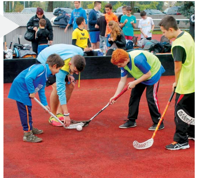
A Karinthy Frigyes Általános Iskola 4. osztálya készítette el a győztes ételt