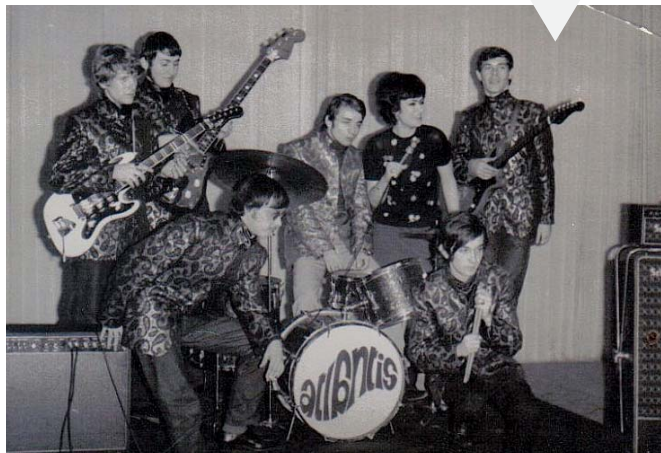
Az Atlantis Együttes 1967-ben