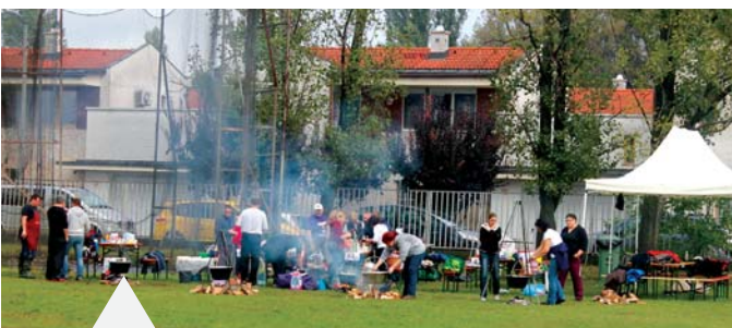
A napokig tartó esőzés sem tántorította el a Sportparty főzőcsapatait, hogy versenybe szálljanak a legjobb chili con carne címéért