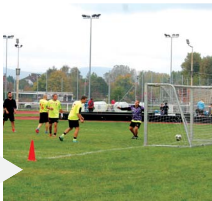
Kispályás foci nélkül nincs Sportparty