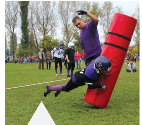
Bemutatót tartott az Újpest Bulldogs Amerikai Futball Club