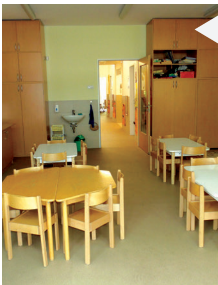
Megújultak a csoportszobák is