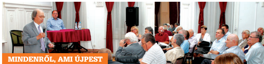
MINDENRŐL, AMI ÚJPEST