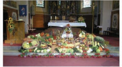
Adományaitok, például zöldséget, gyümölcsöt, befőttet, tartós élelmiszert a terménymegáldásra, október 3. szombat délelőtt 8-11 óra között várjuk a templomban!

A megáldott termények szétosztása rászorulóknak, nagycsaládosok, szegények között, október 4., vasárnap 15.00 órakor lesz a templom bejáratánál!