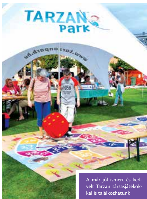
A már jól ismert és kedvelt Tarzan társasjátékkal is találkozhatunk