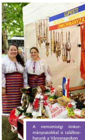
A nemzetiségi önkormányzatokkal is találkozhatunk a Városnapokon