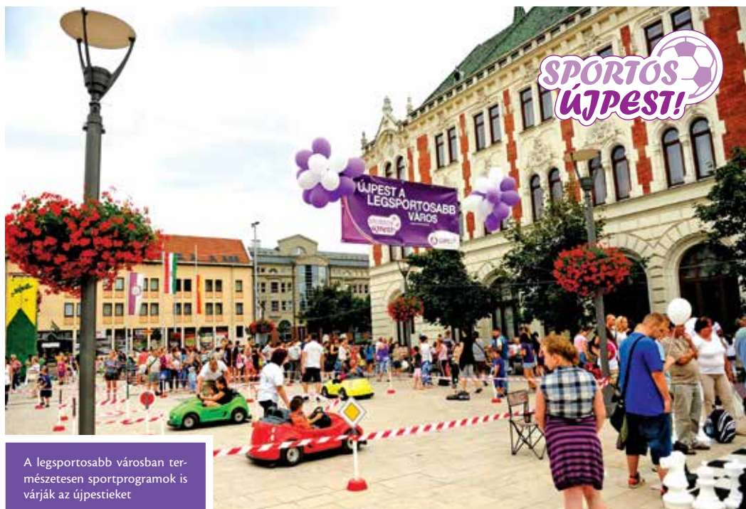
A legsportosabb városban természetesen sportprogramok is várják az újpestieket