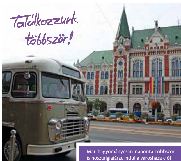
Már hagyományosan naponta többször is nosztalgiajárat indul a városháza elől