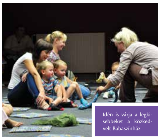
Idén is várja a legkisebbeket a közkedvelt Babaszínház