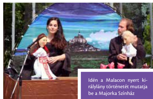
Idén a Malacon nyert királynő történetét mutatja be a Majorka Színház