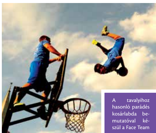
A tavalyihoz hasonló parádés kosárlabda bemutatóval készül a Face Team