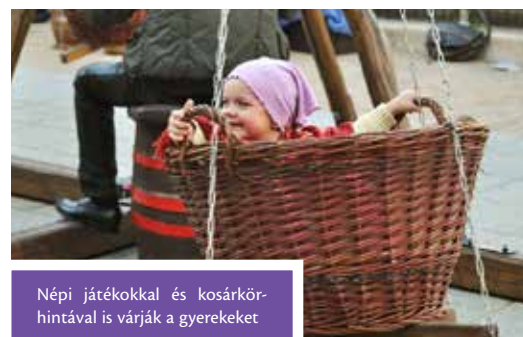
Népi játékokkal és kosárkörhintával is várják a gyerekeket