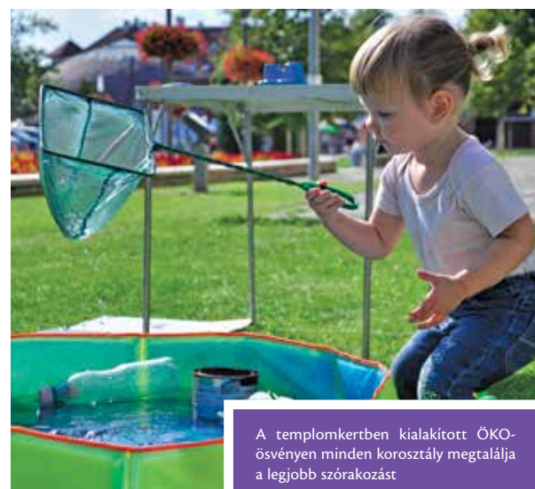
A templomkertben kialakított ÖKO-ösvényen minden korosztály megtalálja a legjobb szórakozást