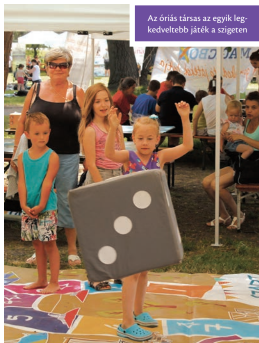
Az óriás társas az egyik legkedveltebb játék a szigeten