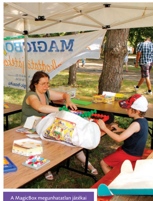
A MagicBox megunhatatlan járákai