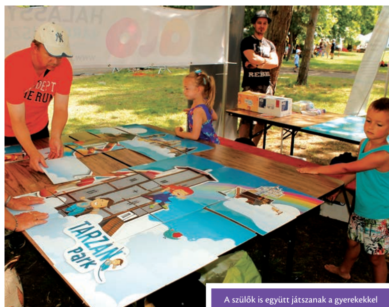
A szülők is együtt játszanak a gyerekekkel