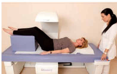
Teljes test csontsűrűségmérés