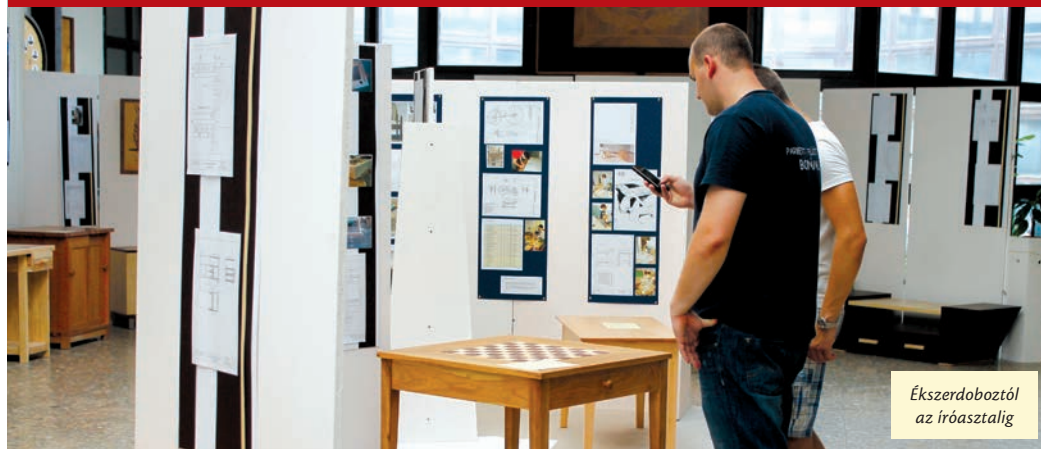
Ékszerdoboztól az íróasztalig