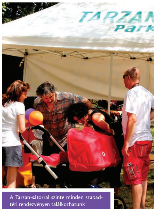
A Tarzan-sátorral szinte minden szabadtéri rendezvényen találkozhatunk