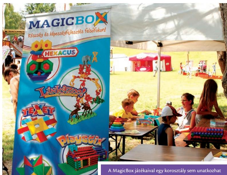
A MagicBox játékaival egy korosztály sem unatkozhat