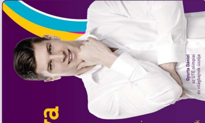
Gyurta Dániel az ÚTE olimpiai és világbajnok úszója