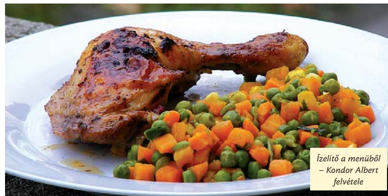
Ízeltő a menüből

si és egészségmegőrzési szempontok alapján. Ehhez, valamint a változatos étrendhez és menükínálathoz egyaránt segítenének a beküldött receptek. Fontosnak tartom kiemelni, hogy a receptgyűjtéssel nem a kórházi étkeztetést akarjuk megváltoztatni, bár