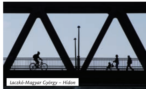
Laczkó-Magyar György – Hídon