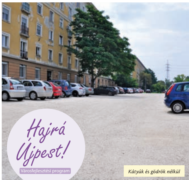
Kátyúk és gödrök nélkül