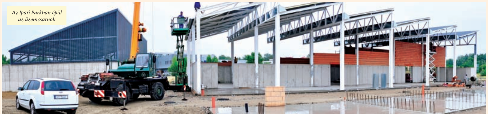
Az Ipari Parkban épül az üzemszarnok