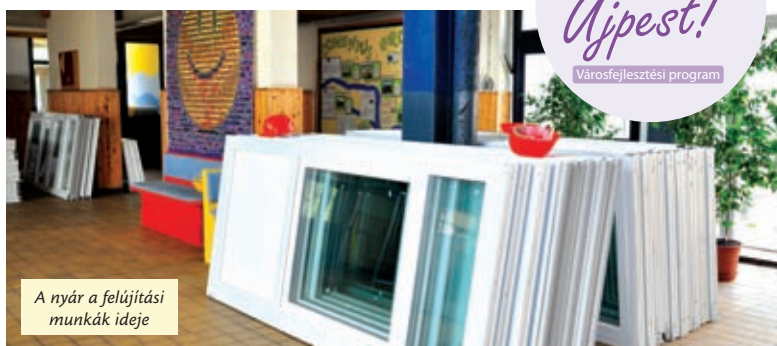
A nyár a felújítási munkák ideje