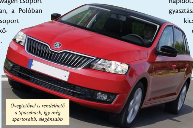
Üvegtetővel is rendelhető a Spaceback, így még sportosabb, elegánsabb

már jól ismerünk. A másik hárombenzines motor viszont már turbós. Az újabb, négyhengeres 1,2 literes gép 86 és 105 lóerővel készült, a benzines csúcsmotollal pedig 1,4 literes, 122 lovas TSI motort szerelnek. Dízelmotorból 1,6 literes, négyhengeres kapható 90 és 105 lóerős kivitelben. Az általunk tesztelt 105 lóerős, ezerkettes TSI motor sportosan, dinamikus mozgatta a közel 1200 kg ösztömegű Rapidot. Nagyon gazdaságos a fogyasztása, hiszen városi forgalomban kicsit több mint hat literrel megelégedett. A váltója a Volkswagen csoporttól megszkott precíz, finom szerkezet, nagyon rövid utakat jár be a váltókar. Ehhez a motorhoz hatsebességes verzió jár, amivel országúton, autópályán a dízelekkel vetekedő fogyasztást érhetünk el.