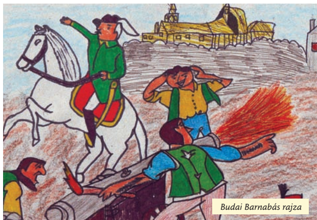
Budai Barnabás rajza