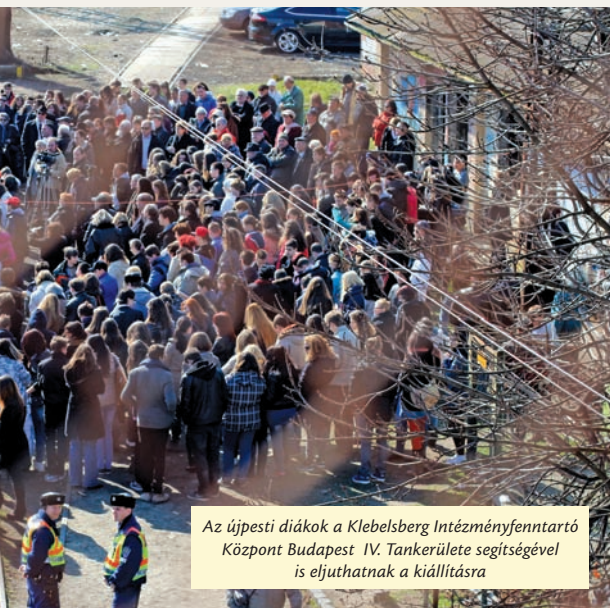
Az újpesti diákok a Klebelsberg Intézményfenntartó Központ Budapest IV. Tankerülete segítségével is eljuthatnak a kiállításra

Hozzáteszi: külön örülnek annak, hogy a különböző felméréseken, így a hallás-, látás-, színlátásvizsgálaton ezentúl nyugodt, intim körülmények között vehetnek részt, úgy, hogy lehetőleg egyszerre csak egy kisgyerek-anyuka tartózkodjon a helyiségben, mint az orvosi rendelőben.