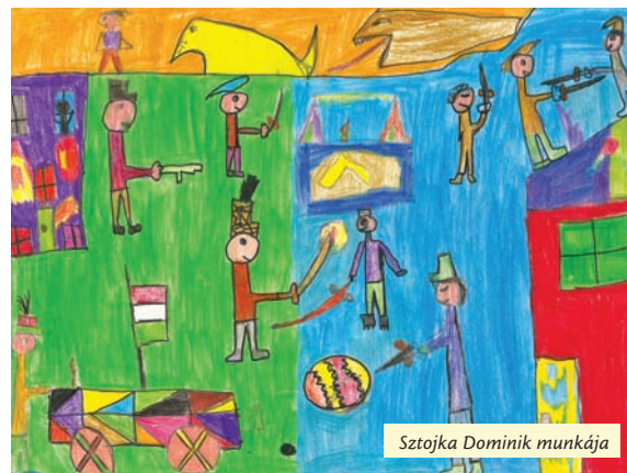
Sztojka Dominik munkája