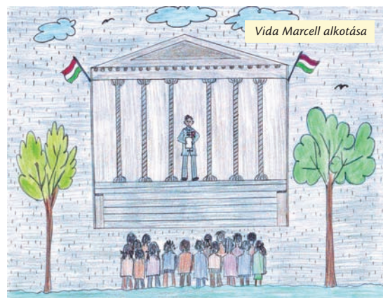
Vida Marcell alkotása