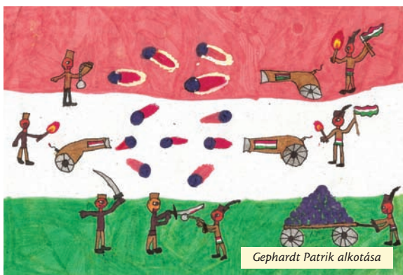
Gephardt Patrik alkotása