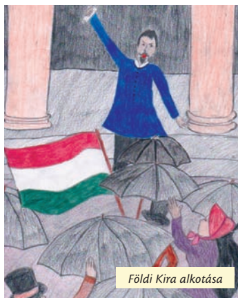
Földi Kira alkotása