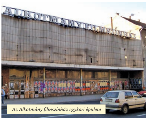
Az Alkotmány filmszínház egykori épülete

Közvetlenül mellette magasodott az Alkotmány „filmszínház” (azelőtt Corso mozi). Premiermozi lévén ott játszották az „új”, a nekünk tetsző filmeket, és ott tartotta a Könyves legtöbb iskolai ünnepségét. (Vagy a Szabadságban, de mára nyomuk sem maradt. Ma nincs mozi Újpesten.) A szavalt és a Himnusz(ok) után jött a beszéd, majd levetítették az alkalomra kötelező filmalkotást, egy aktuális szovjet filmet. Volt jó (Tiszta égbolt, Egy év kilenc napja), de egyik sem olyan, mint a Bátor emberek, az Őrs a hegyekben vagy a Lángban álló szigettenger! Iskolás éveink nagy akciófilmjei! A sztár Orrlik, a ló, a Bátor emberek főhőse. De a Királylány a feleségem – különös „tekintettel” Gina Lollobrigida mellkivágására – ötször volt nézendő! És az Alkotmányban volt a Nivram-koncert is! Jocóval!