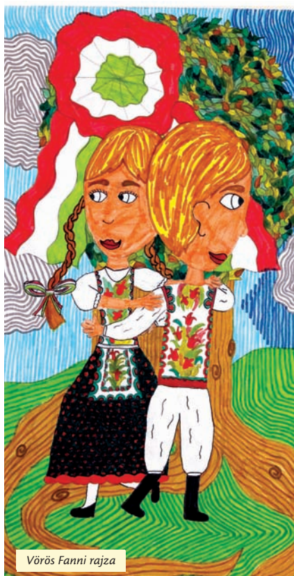
Vörös Fanni rajza