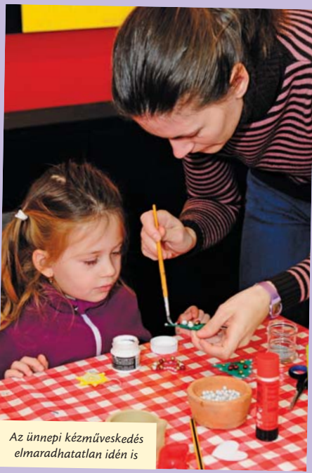
Az ünnepi kézműveskedés elmaradhatatlan idén is