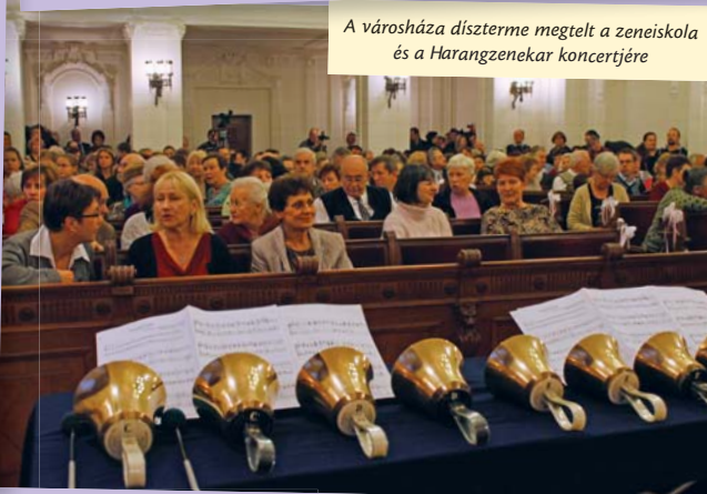
A városháza díszterme megtelt a zeneiskola és a Harangzenekar koncertjére