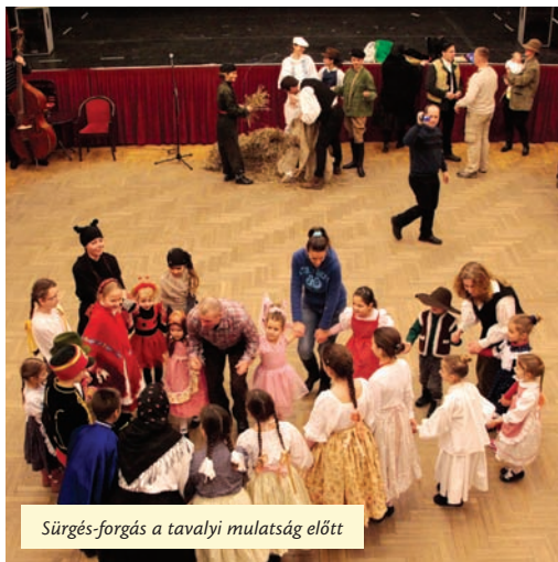
Sürgés-forgás a tavalyi mulatság előtt