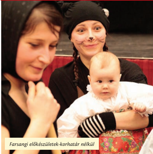
Farsangi előkészületek-korhatár nélkül