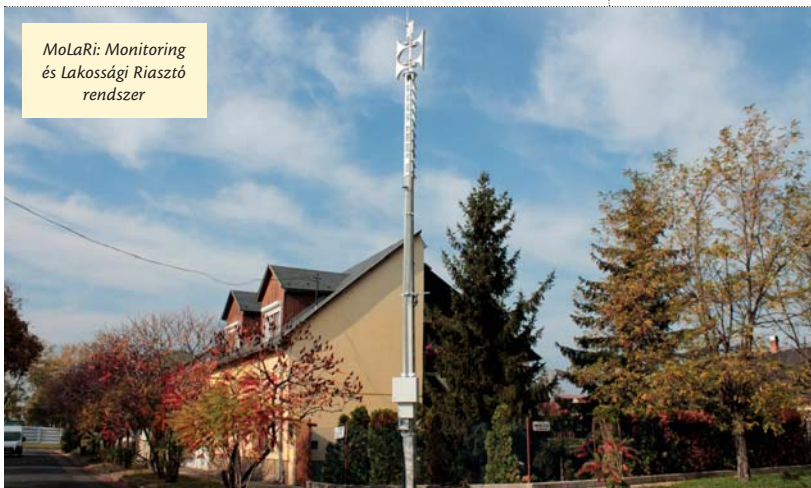
MoLaRi: Monitoring és Lakossági Riasztó rendszer