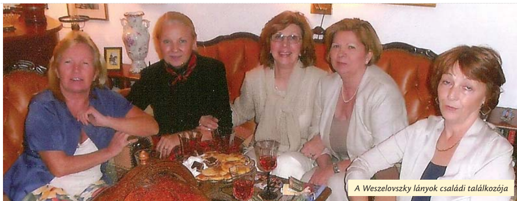
A Weszelovszky lányok családi találkozója

A rovat tanácsadó szakértői: Szöllősy Marianne és Krizsán Sándor helytörténész. Sorozatunkat kövesse a www.facebook.com/ujpest.kapostasmegyert oldalon is!