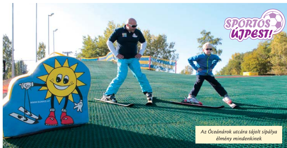
Az Óceánárok utcára tájolt sípálya élmény mindenkinek

Az árvácskák az egyvári virágok szíromhullása után, ősszel is színompássá teszik a környezetünket.