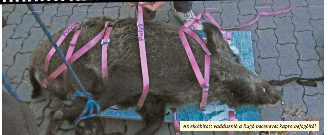
Az elkábított vaddisznó a Rugó becenevet kapta befogótól