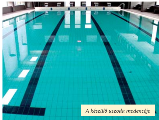
A készülő uszoda medencéje

A tárlat október 6-ig tekinthető meg, aki pedig szeretne az alkotóval találkozni, október 2-án 11 és 12 óra között, szeptember 27-én és október 4-én pedig délután 16 és 18 óra között teheti meg. M. O. A.