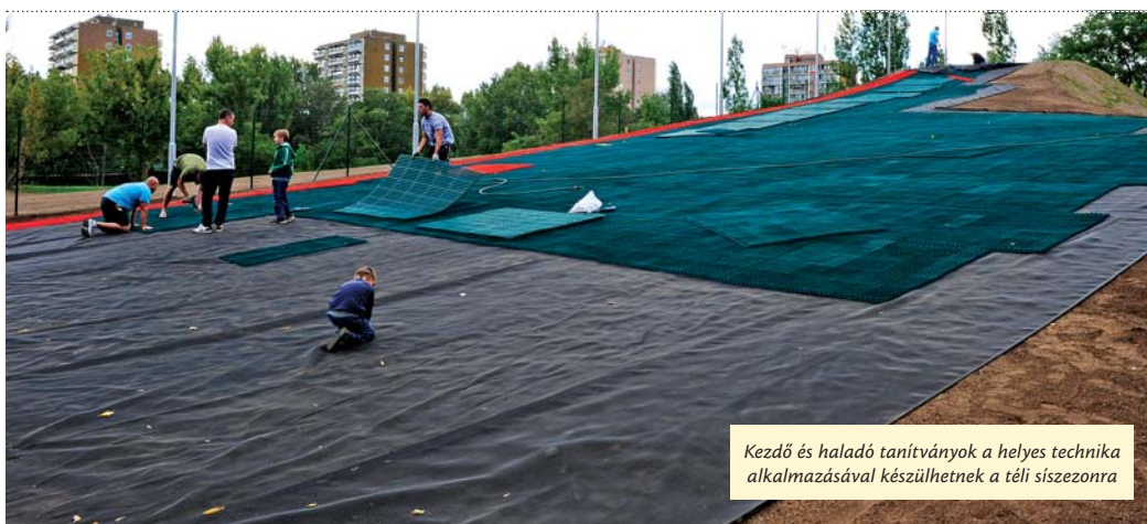
Kezdő és haladó tanítványok a helyes technika alkalmazásával készülhetnek a téli síszezonra