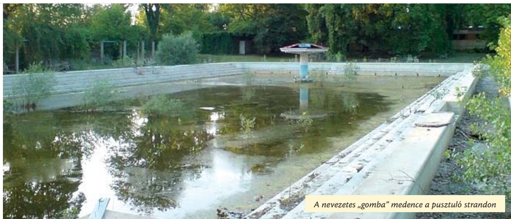
A nevezetes „gomba” medence a pusztuló strandon

Ha Budapesten lehet jelképpé, ikonná vált strandokat megnevezni, akkor ez hárommal tehető meg „istenigazából”: a Dagályal, a Palatinusszal és a