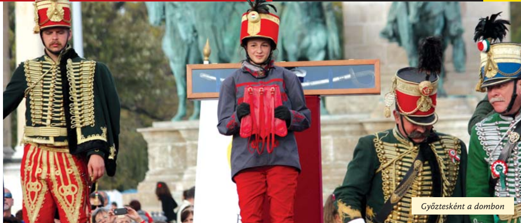
Győztesként a dombon

– Nem ez volt az első alkalom, hogy a Nemzeti Vágtára neveztem. Sajnos két évvel ezelőtt, a döntőben nagyot buktam, lemaradtam a helyezésről. De nem adtam fel, hittem abban, hogy egyszer sikerül a győzelem – mondja a tizenhat éves, filigrán lány, aki a versenyzést követően kétnapos szusszanásnyi időt kapott pihenésre középiskolájától, az Ady Endre Gimnáziumtól.