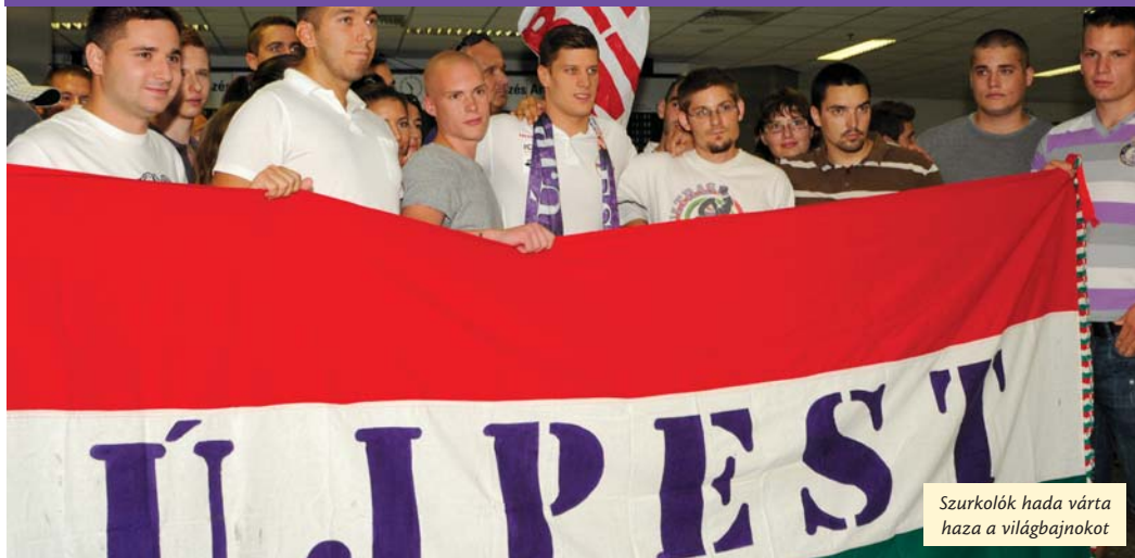
Szurkolók hada várta haza a világbajnokot