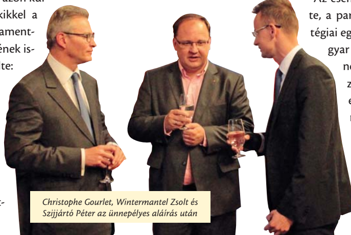
Christophe Gourlet, Wintermantel Zsolt és Szijjártó Péter az ünnepélyes aláírás után

Szijjártó Péter külügyi és külgazdasági államtitkár külön köszöntötte Wintermantel Zsoltot , hozzátéve: Újpest polgármesterének jelenléte is mutatja, hogy Újpest és a Sanofi együttműködése példaszerű, emellett rávilágít arra is, hogy a stratégiai megállapodás nemcsak nemzetgazdasági szempontból, hanem helyi szinten is fontos.