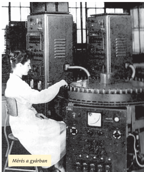
Mérés a gyárban

Egy munkasoron, a választóútra nézőn dolgozott néhány nő, akik berakták a csövet egy foglalatba, majd kis gumikalapáccsal két oldalról megkalapálták, vizsgálva, hogy bírja-e a „strapát”. Aztán küldték tovább.