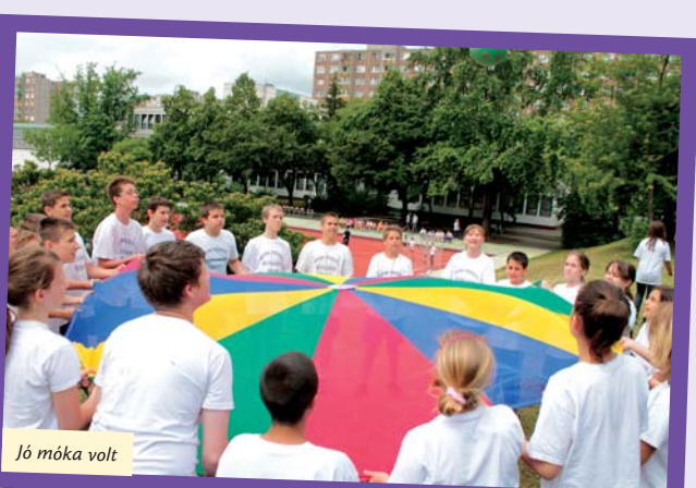
Jó móka volt