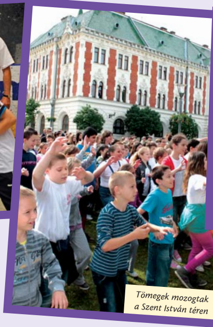
Tömegek mozogtak a Szent István téren