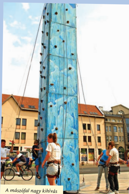
A mászófal nagy kihívás