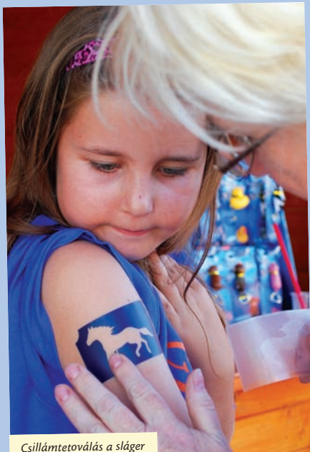
Csillámtetoválás a sláger