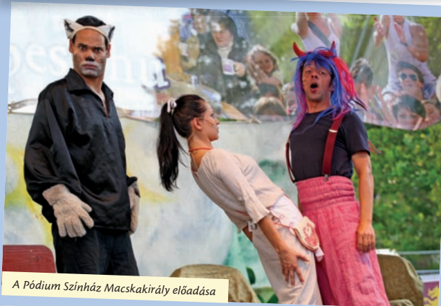
A Pódium Színház Macskakirály előadása