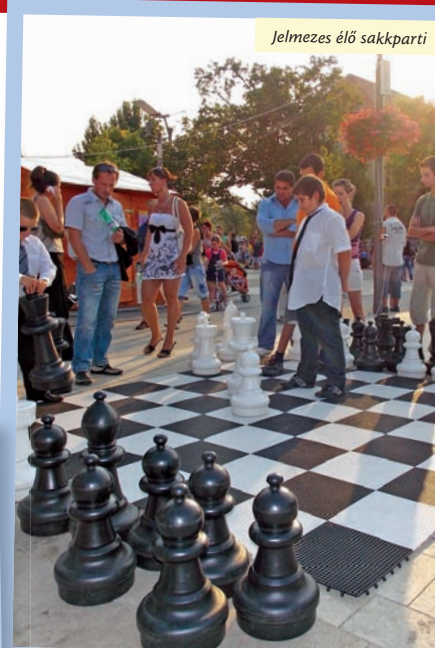
Jelmezes élő sakkparti