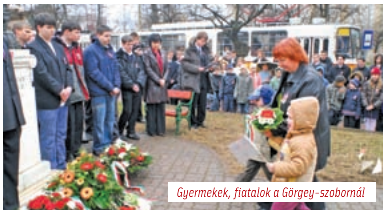
Gyermekek, fiatalok a Görgey-szobornál