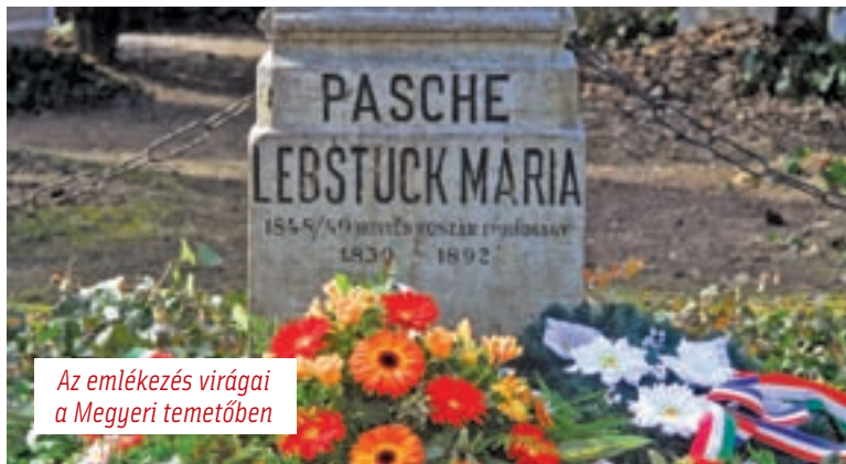
Az emlékezés virágai a Megyeri temetőben