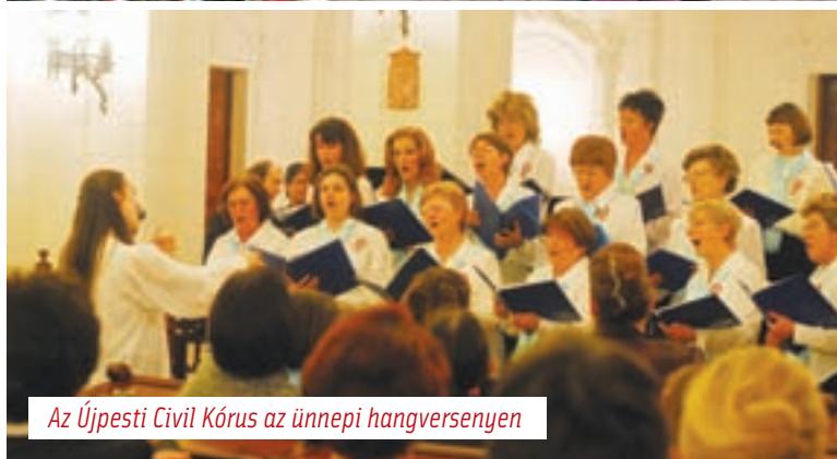
Az Újpesti Civil Kórus az ünnepi hangversenyen