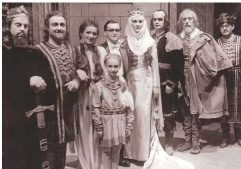
1947-ben II. Endrét játszotta a Bánk bánban

Napjainkban ádáz vita dúl, hogy a három tenor – Carreras, Pavarotti és Domingo – közül ki a legnagyobb. Ötven évvel ezelőtt ez nem lehetett kétséges: a tenorok koronázatlan királya, „a Hang” Beniamino Gigli volt, aki száztizenöt éve, 1890. március 20-án született Recanatiban.