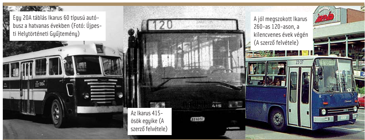
Egy 20A táblás Ikarus 60 típusú autóbusz a hatvanas években