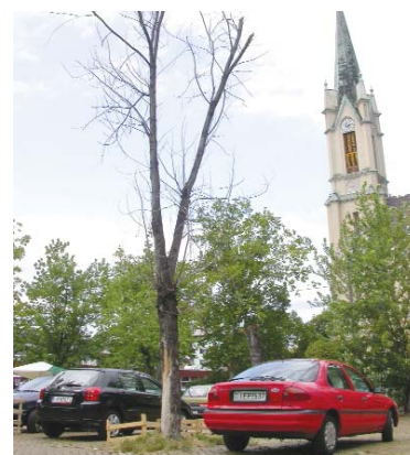
Az István teret még veszélyezteti...

Ezek a fák, ágak komoly veszélyt jelenthetnek egy esetleges viharban. Ami tőlünk telik, meg kell tennünk a baj megelőzése érdekében. Ezért arra kérek minden önkormányzati képviselőt, járja be körzetét, s ha hasonlókat tapasztal, jelentse be az önkormányzatnál. Ezzel is segíthetjük a Városüzemeltetési Osztály munkatársainak magas színvonalú munkáját.