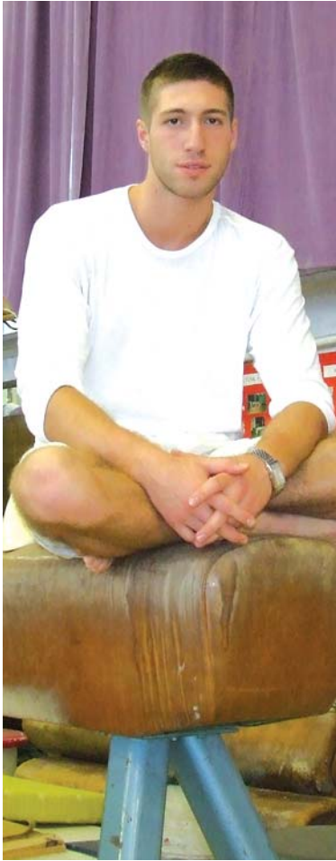
Az UTE sportolója vagy, de általában a KSI-ben edzel. Miért?